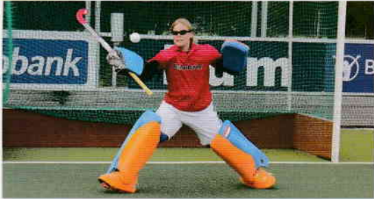
※オランダ・フィールドホッケー1部リーグ所属の3チーム20名によるテスト 3か月トレーニングの前後で8種類のフィールドテストを実施 各チームの専属オプトメトリストが視覚能力を測定